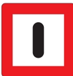
Gebot besonderer Vorsicht