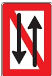
Verbot des Begegnens und Überholverbot