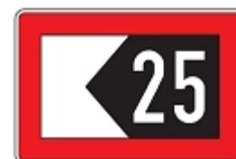
Fahrwassereinengung, Abstand in Metern vom Tafelzeichen entfernt halten