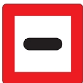
Gebot unter bestimmten Bedingungen anzuhalten