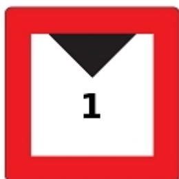
Die lichte Höhe über dem Wasserspiegel ist begrenzt