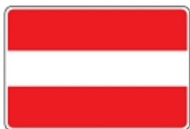
Verbot der Durchfahrt