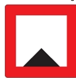
Die Fahrwassertiefe ist begrenzt