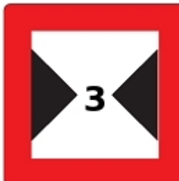
Die Breite der Durchfahrtsöffnung oder des Fahrwassers ist begrenzt