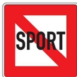
Fahrverbot für Sportboote