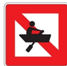
Fahrverbot für Fahrzeuge ohne Motor oder Segel